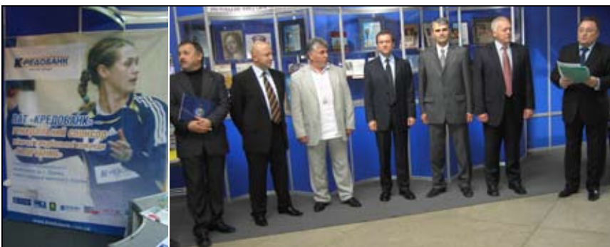
На знімках: (вгорі справа) – підписанти договору про партнерство в галузі спорту; (вгорі зліва) – плакат-афіша гандбольної команди “Таличанка”; (внизу) – стенд з книжками Видавничого центру.