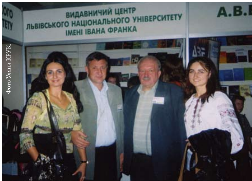
Працівники Видавничого центру – учасники XIV Форуму видавців у Львові.

З 13 по 16 вересня Львів учотирнадцяте став господарем Форуму видавців. Приємно, що одним із співorganizаторів свята шанувальників книги був Львівський національний університет імені Івана Франка. Відзначимо, що на XIV Форум видавців із різних куточків України та із-за її меж прибуло близько 600 учасників. Причому 190 з них – це представники видавництва.