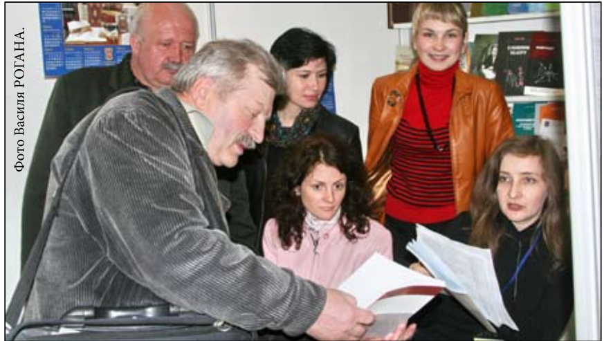
На знімку: університетські видавці на спеціалізованому ярмарку “Освіта-2008”.

Досить представницьким був спеціалізований ярмарок “Освіта-2008”, який організувала громадська організація “Форум видавців” за сприяння Міністерства освіти і науки України та Академії педагогічних наук України. 8-10 травня до Палацу мистецтв міста Лева поспішали поціновувачі наукової та навчальної літератури, щоб побачити і заодно придбати необхідну їм книжку. Окрім Львівського національного університету імені Івана Франка, який виставив понад сто різноманітних видань, свій поліграфічний доробок демонстрували видавці ще близько п'ятнадцяти вищих на-