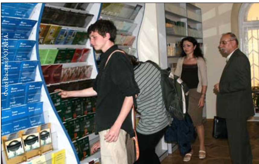
На знімку: перші відвідувачі книгарні щиро раді довгожданому новосіллю.